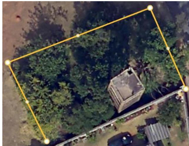
Localização dos Reservatórios Alto da Colina.