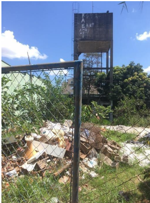
Reservatório elevado desativado localizado no Parque Florence.

Segundo a Lei nº 12.305/10 que trata da Política de Resíduos Sólidos, as empresas geradoras são responsáveis por todos os resíduos que são retirados e manuseados, portanto deverá destinar os restos de materiais em locais adequados.