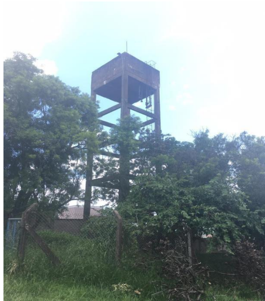
Reservatório elevado desativado localizado no Jardim Alto da Colina.