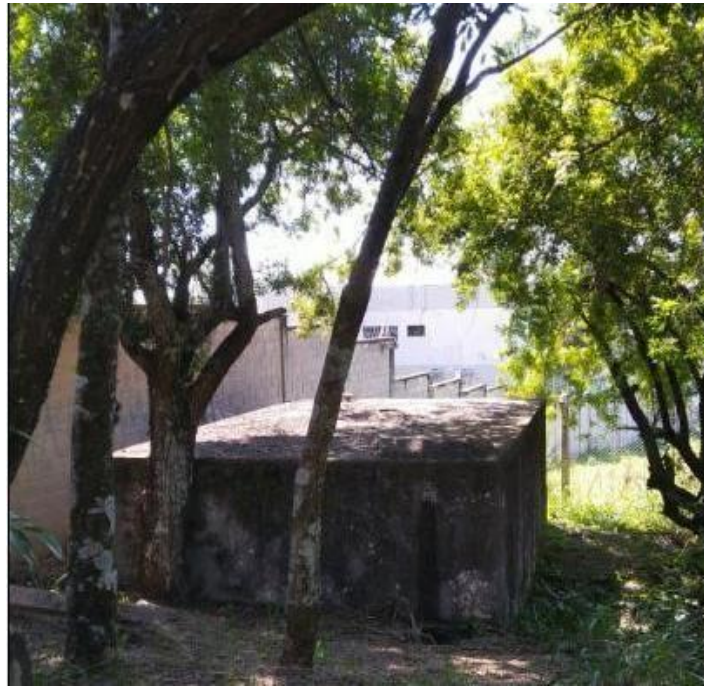
Reservatório semienterrado desativado localizado no Jardim Alto da Colina.