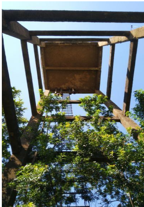
Vista do interior do reservatório elevado desativado localizado no Jardim Alto da Colina.