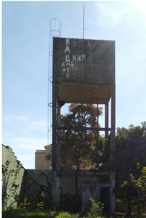
Reservatório elevado desativado e casa de máquinas no Parque Florence.